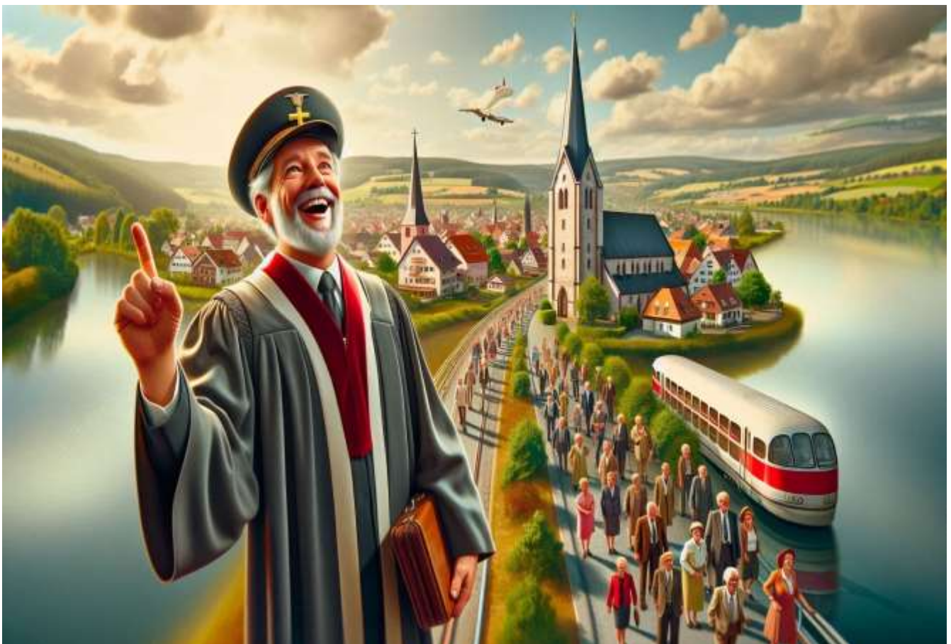
Foto: erstellt mit Dall-E